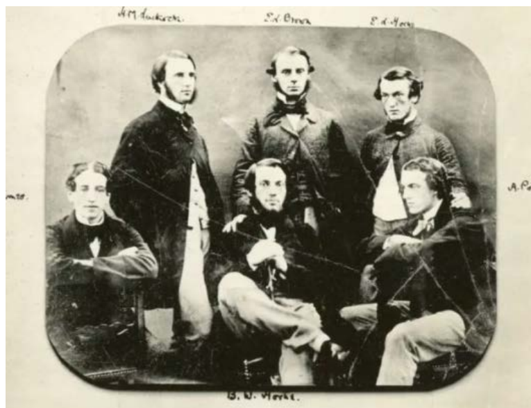
參與制定劍橋規則的部分成員，攝於 1854 年

19 世紀初期，牛津和劍橋之間進行足球比賽，他們組織並制定了一項規則，即劍橋規則 ( Cambridge Rules )，每隊有 11 個隊員進行比賽。據說因為當時在學校裡每間宿舍住有十個學生和一位教師，因此他們就每方 11 人進行宿舍與宿舍之間的比賽。